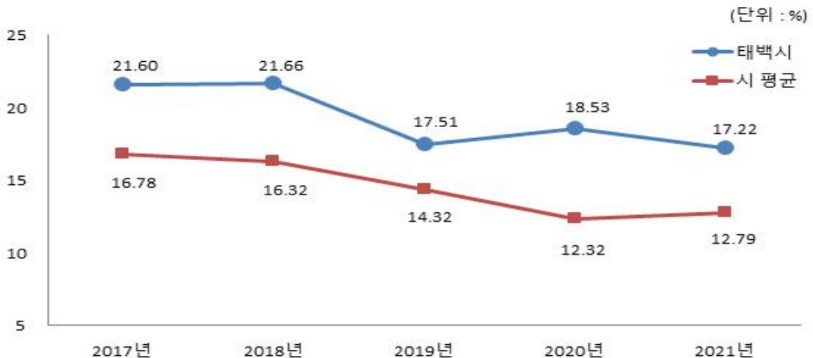
유형 지방자치단체와 재정자립도(당초예산) 비교